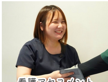
看護アセスメント