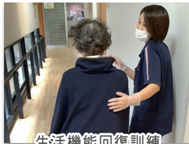
生活機能回復訓練