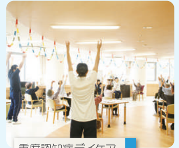
重度認知症デイケア

家庭や地域で自立した生活が送られるように“こころ”のリハビリテーションを提供いたします。