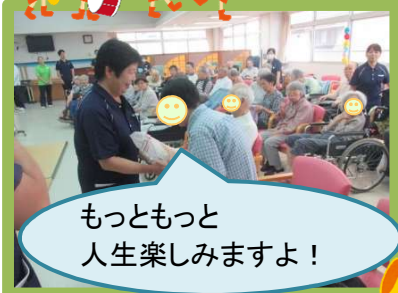
もっともっと人生楽しめますよ!