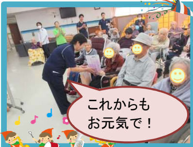
これからもお元気で!