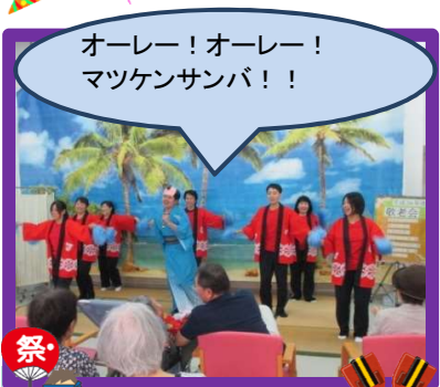
オーレー!オーレー! マツケンサンバ!!