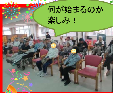
何が始まるのか楽しみ!