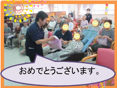
おめでとうございます。

今年もたくさんのご家族の方々に参加していただき、楽しく敬老会 を終えることができました。 今後利用者さんやご家族に楽しんでいただけるような企画を考えて いきます。