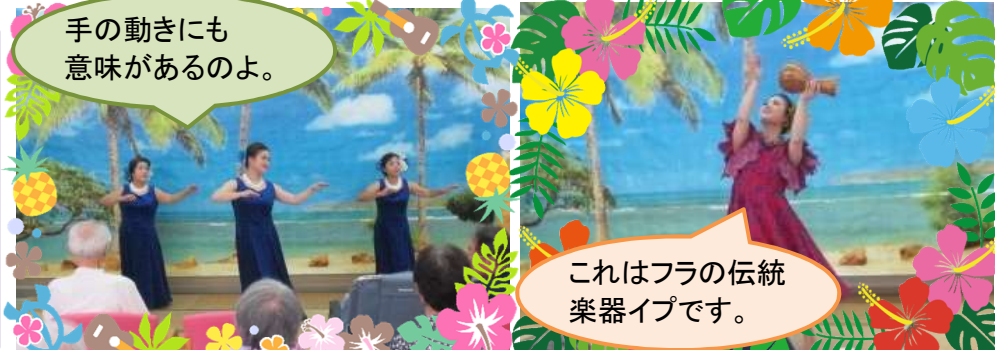
手の動きにも 意味があるのよ。