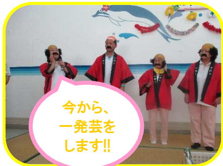
今から、一発芸をします!!