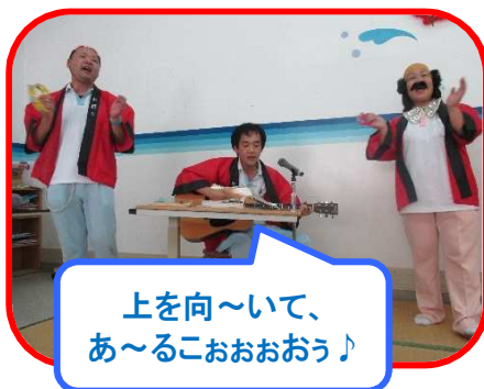
上を向～いて、あ～るこおおう♪