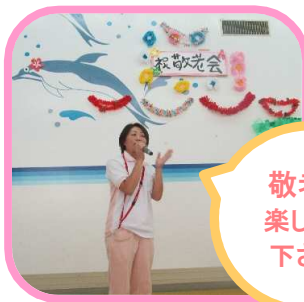
敬老会楽しんで下さい!!